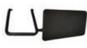
BRAZO CON PALA NYLON