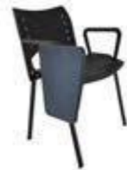
BRAZO CON PALA NYLON Ñ BRAZO