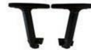
BRAZOTECNO D Nylon. Reg. Altura/Profundidad. Suplemento regulación D "Anchura", €