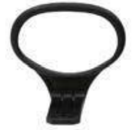
BRAZO / Polipropileno