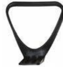
BRAZO / Polipropileno