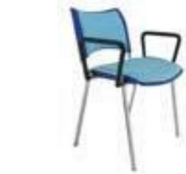
JUEGO DE BRAZO