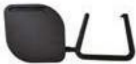
* SUPLEMENTO PALA IZQUIERDA