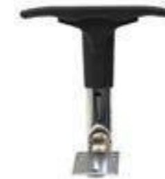
BRAZO D Acero Cromado/Poliamida. Reg. Altura