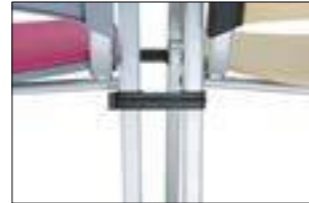
SISTEMA DE UNIÓN ESTÁNDAR