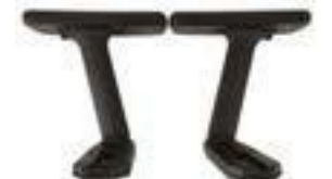
BRAZODYMEN D NOVEDAD Nylon/Topen Poliuretano. Reg. Altura/Profundidad/Giro. Suplemento regulación D "Anchura", €