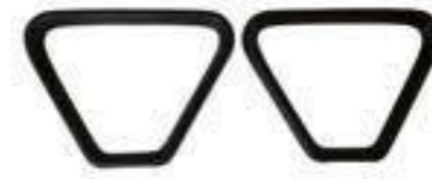
BRAZOTWO / Polipropileno