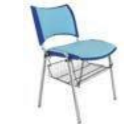
PARRILLA PORTA LIBROS