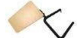
BRAZO CON PALA HAYA