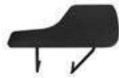
BRAZO CON PALA GRANDE