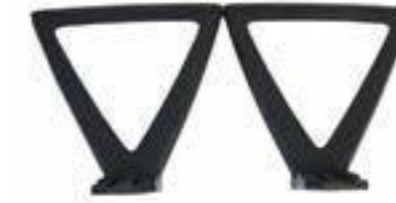
BRAZO / Polipropileno