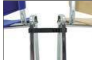
SISTEMA DE UNIÓN EXTENSIBLE