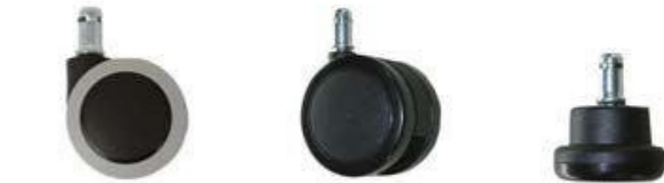
ESTÁNDAR STYLE BLANDA D. • Suelos delicados NOVEDAD