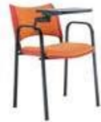
PALA NYLON SILLA CON BRAZOS