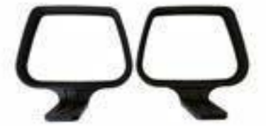
BRAZOBRETON / Polipropileno