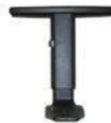
BRAZO D Nylon. Reg. Altura