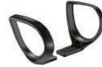
BRAZOSTAR / Polipropileno