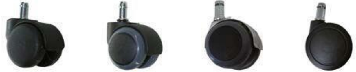
ESTÁNDAR D. •