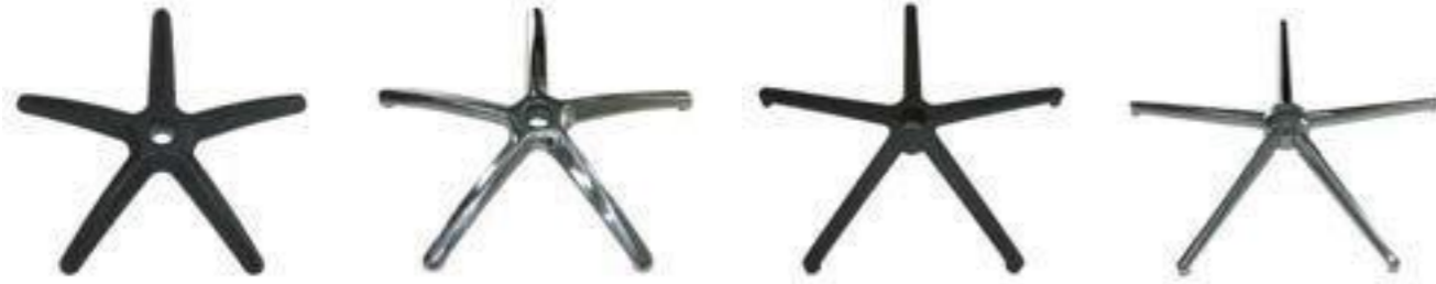
ESTÁNDAR NYLON D.