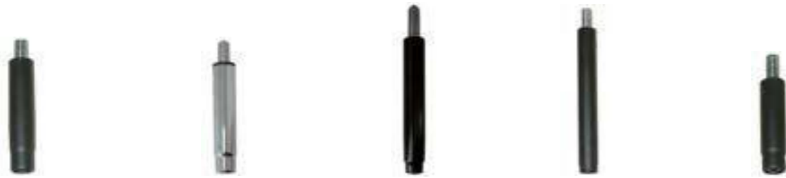
OPERATIVA • /•

Di onemos de otros modelos de pi ones a consultar.